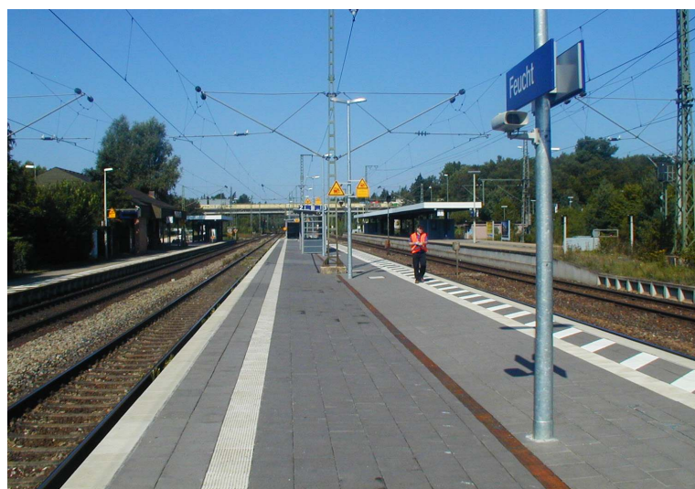
Bei der Stationserhebung am Bahnhof Feucht