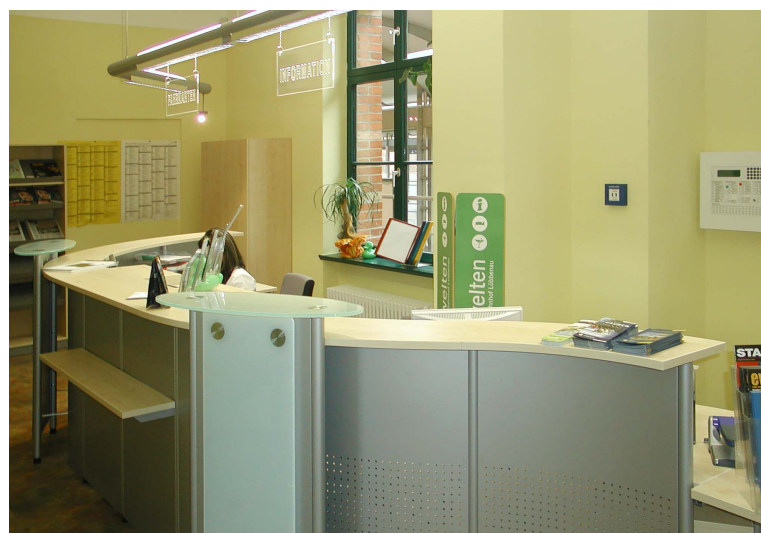
Die Mobilitätszentrale als wichtiger Baustein des Nutzungskonzeptes