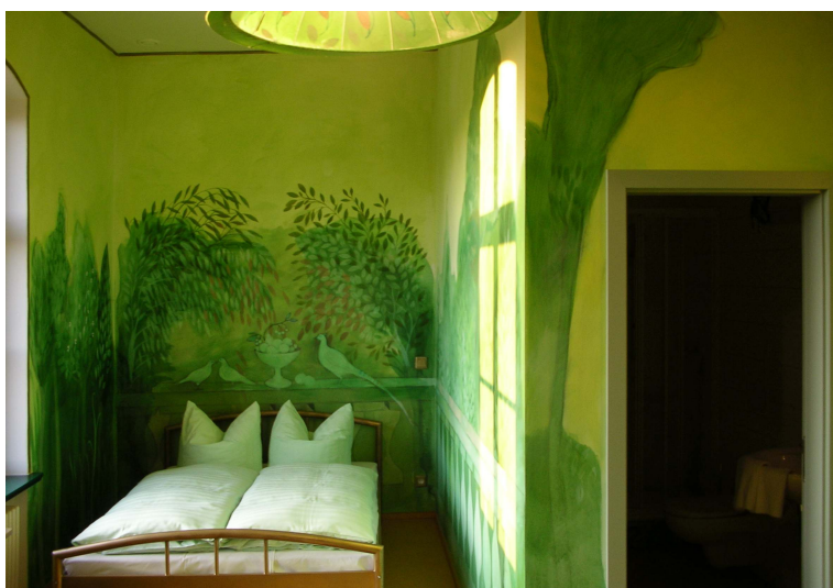
Eines der von lokalen Künstlern gestalteten Zimmern der Pension im 1. Obergeschoss