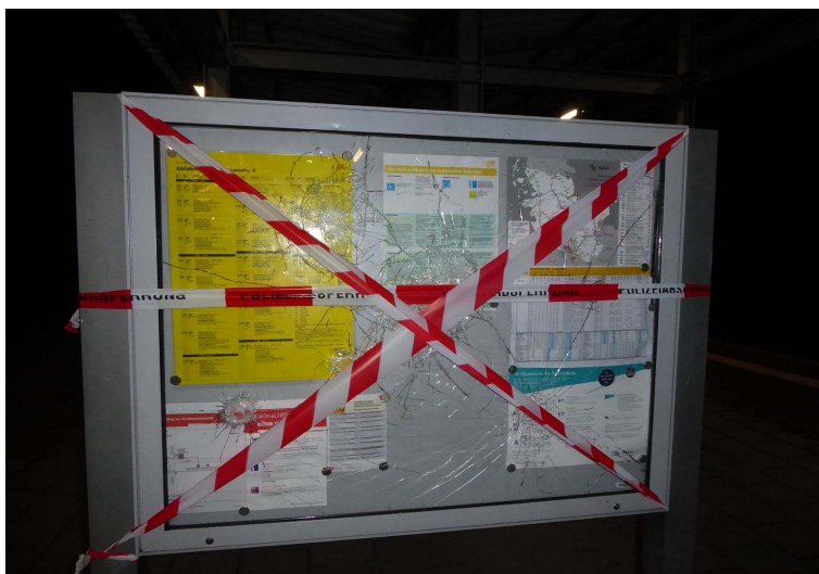
Eine durch Vandalismus zerstörte Vitrine in Lensahn

2001-2018 (Schleswig-Holstein), seit 2012 (Bremen/Niedersachsen)