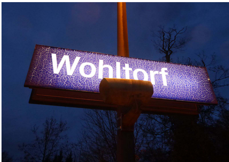
Einige Bahnhofsnamenschilder weisen Alterungserscheinungen auf