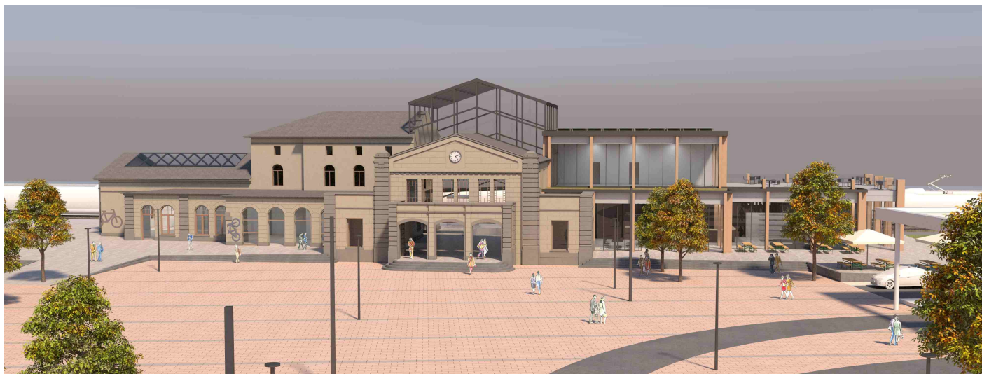
Erste Konzepte für das neue Gebäude zeigen eine Mischung aus Alt und Neu in der historischen Kubatur