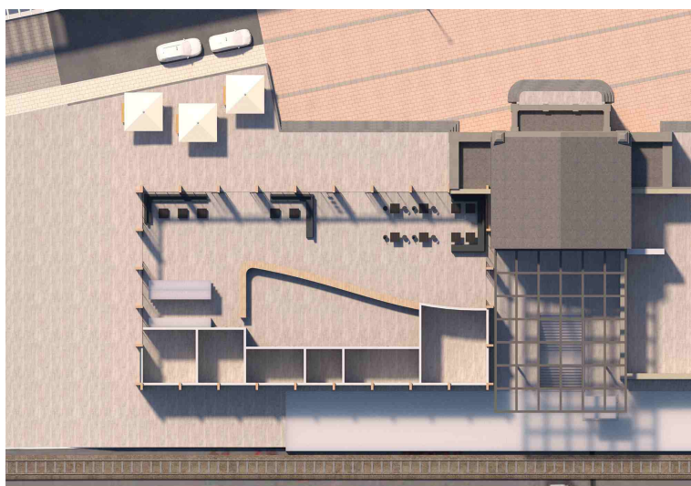
Im Rahmen der Konzeption wurden mehrere Varianten der Raumprogramme erarbeitet