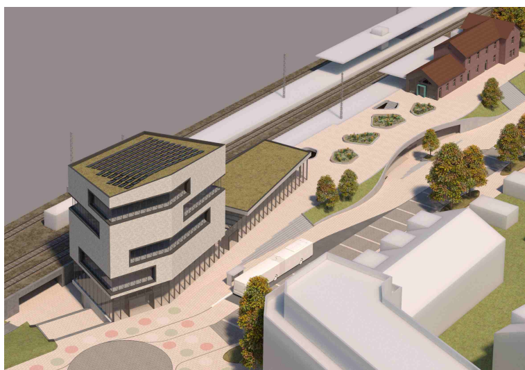
Visualisierung Vorzugsvariante II