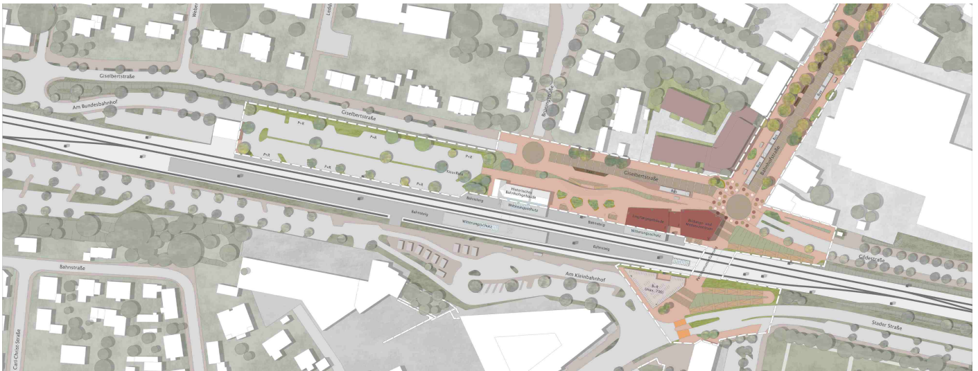
Masterplan Vorzugsvariante II