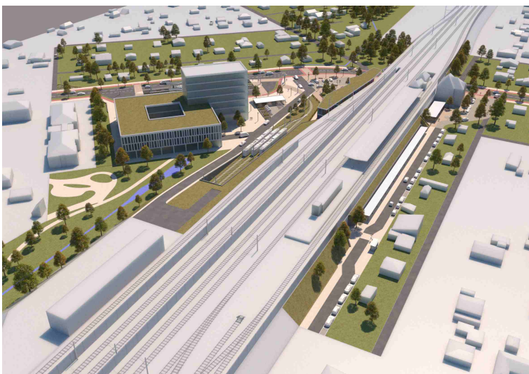
Übersicht von Norden