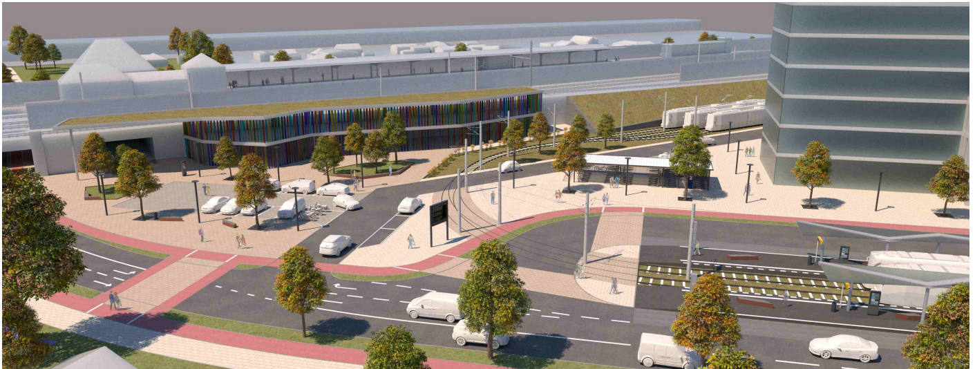
Bahnhofsvorplatz mit Straßenbahn und Fahrradparkhaus