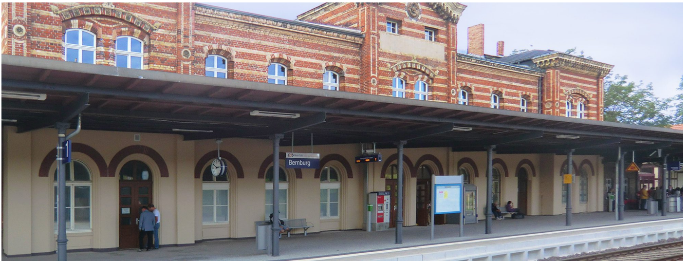
Rundum erneuert sind seit 2012 die Bahnsteige und das Empfangsgebäude in Bernburg (Saale)