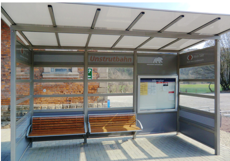
Entlang der Unstrutbahn zwischen Naumburg und Nebra wurden 2012 alle Bahnsteige erneuert; das Mobiliar erhielt eine attraktive Gestaltung